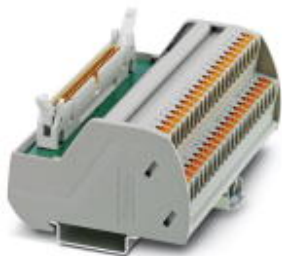
Интерфейсный модуль VARIOFACE, с зажимами Push-in, для 32 каналов

Обратите внимание на то, что приведенные здесь данные взяты из online-каталога. Полная информация и данные содержатся в документации пользователя. Действуют Общие условия использования для информации, загруженной из интернета. ( http://phoenixcontact.ru/download )