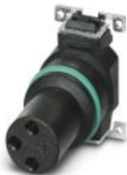
Комплект образцов, 3-полюсн., Гнездо, прямое, M8, A-кодирование, Монтаж на печатную плату, SMD

Обратите внимание на то, что приведенные здесь данные взяты из online-каталога. Полная информация и данные содержатся в документации пользователя. Действуют Общие условия использования для информации, загруженной из интернета. ( http://phoenixcontact.ru/download )