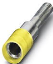
Гнездо для щупа тестера, цвет: желтый

Обратите внимание на то, что приведенные здесь данные взяты из online-каталога. Полная информация и данные содержатся в документации пользователя. Действуют Общие условия использования для информации, загруженной из интернета. ( http://phoenixcontact.ru/download )