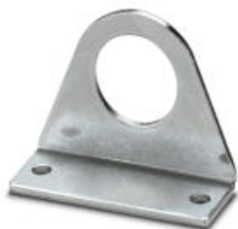
Уголок для крепления защитных шлангов, крепление двумя винтами

Обратите внимание на то, что приведенные здесь данные взяты из online-каталога. Полная информация и данные содержатся в документации пользователя. Действуют Общие условия использования для информации, загруженной из интернета. ( http://phoenixcontact.ru/download )