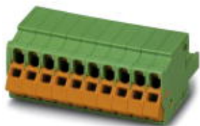
На рисунке показан 10-контактный вариант изделия

Обратите внимание на то, что приведенные здесь данные взяты из online-каталога. Полная информация и данные содержатся в документации пользователя. Действуют Общие условия использования для информации, загруженной из интернета. ( http://phoenixcontact.ru/download )