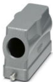
Сальниковый корпус HEAVYCON B24, для крепления одной защелкой, высота 76 мм, с резьбой 1x M32, боковое подсоединение кабеля

Обратите внимание на то, что приведенные здесь данные взяты из online-каталога. Полная информация и данные содержатся в документации пользователя. Действуют Общие условия использования для информации, загруженной из интернета. ( http://phoenixcontact.ru/download )