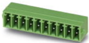
На рисунке показан 10-контактный вариант изделия

Корпусная часть для печатных плат, номинальный ток: 8 А, расчетное напряжение (III/2): 160 В, полюсов: 20, размер шага: 3,5 мм, цвет: зеленый, поверхность контакта: олово, монтаж: Пайка волной припоя