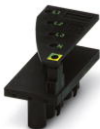
Штекер подачи питания, для силовых клемм Inline

Обратите внимание на то, что приведенные здесь данные взяты из online-каталога. Полная информация и данные содержатся в документации пользователя. Действуют Общие условия использования для информации, загруженной из интернета. ( http://phoenixcontact.ru/download )