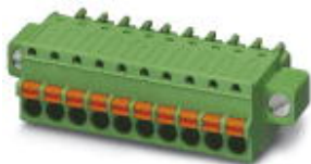
На рисунке показан 10-контактный вариант изделия

Разъемы для печатной платы, номинальный ток: 8 А, расчетное напряжение (III/2): 160 В, полюсов: 12, размер шага: 3,5 мм, тип подключения: Пружинные зажимы Push-in, цвет: зеленый, поверхность контакта: олово