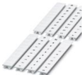
Маркировочная планка Zack, 10 элементов, с надписями поперек полосы, цифры по порядку: 21 ... 30, белый, ширина: 8 мм

Обратите внимание на то, что приведенные здесь данные взяты из online-каталога. Полная информация и данные содержатся в документации пользователя. Действуют Общие условия использования для информации, загруженной из интернета. ( http://phoenixcontact.ru/download )