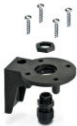
Уголок для монтажа на опоре, черный

Обратите внимание на то, что приведенные здесь данные взяты из online-каталога. Полная информация и данные содержатся в документации пользователя. Действуют Общие условия использования для информации, загруженной из интернета. ( http://phoenixcontact.ru/download )