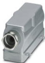
Сальниковый корпус HEAVYCON B24, для крепления двумя защелками, высота 65 мм, с патрубком 1х Pg21, боковое подсоединение кабеля

Обратите внимание на то, что приведенные здесь данные взяты из online-каталога. Полная информация и данные содержатся в документации пользователя. Действуют Общие условия использования для информации, загруженной из интернета. ( http://phoenixcontact.ru/download )