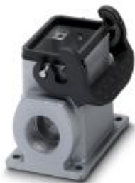
Приборный корпус HEAVYCON B 6, с одной защелкой. Высота 74 мм, с опорой 1 x M25

Обратите внимание на то, что приведенные здесь данные взяты из online-каталога. Полная информация и данные содержатся в документации пользователя. Действуют Общие условия использования для информации, загруженной из интернета. ( http://phoenixcontact.ru/download )