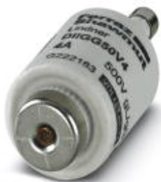
Плавкая вставка, номинальный ток: 4 А, длина: 50 мм, диаметр: 22 мм, цвет: коричневый

Обратите внимание на то, что приведенные здесь данные взяты из online-каталога. Полная информация и данные содержатся в документации пользователя. Действуют Общие условия использования для информации, загруженной из интернета. ( http://phoenixcontact.ru/download )