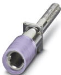
Гнездо для щупа тестера, цвет: фиолетовый

Обратите внимание на то, что приведенные здесь данные взяты из online-каталога. Полная информация и данные содержатся в документации пользователя. Действуют Общие условия использования для информации, загруженной из интернета. ( http://phoenixcontact.ru/download )