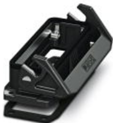
Монтажный корпус HEAVYCON EVO из пластика, B24, с продольной защелкой, высота 30,5 мм, с плоским уплотнением

Обратите внимание на то, что приведенные здесь данные взяты из online-каталога. Полная информация и данные содержатся в документации пользователя. Действуют Общие условия использования для информации, загруженной из интернета. ( http://phoenixcontact.ru/download )