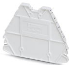
Концевая крышка, длина: 63,6 мм, ширина: 2,2 мм, высота: 48,9 мм, цвет: белый

Обратите внимание на то, что приведенные здесь данные взяты из online-каталога. Полная информация и данные содержатся в документации пользователя. Действуют Общие условия использования для информации, загруженной из интернета. ( http://phoenixcontact.ru/download )