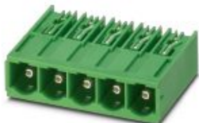
На рисунке показан 5-контактный вариант изделия

Корпусная часть для печатных плат, номинальный ток: 76 А, расчетное напряжение (III/2): 1000 В, полюсов: 10, размер шага: 10,16 мм, цвет: зеленый, поверхность контакта: Серебро, монтаж: Пайка волной припоя