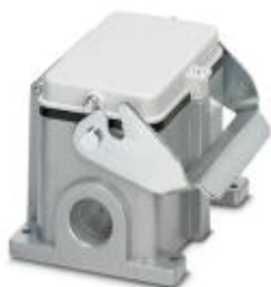
Приборный корпус HEAVYCON B 48, с одной защелкой, высота 100 мм, с опорой 1 x M32, с крышкой

Обратите внимание на то, что приведенные здесь данные взяты из online-каталога. Полная информация и данные содержатся в документации пользователя. Действуют Общие условия использования для информации, загруженной из интернета. ( http://phoenixcontact.ru/download )