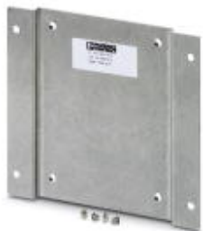
Монтажная пластина для коммутаторов SFNT

Обратите внимание на то, что приведенные здесь данные взяты из online-каталога. Полная информация и данные содержатся в документации пользователя. Действуют Общие условия использования для информации, загруженной из интернета. ( http://phoenixcontact.ru/download )