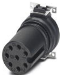
Встраиваемые разъемы, 8-полюсн., Гнездо, прямое, M12, A - стандарт, Монтаж на печатную плату, SMD

Обратите внимание на то, что приведенные здесь данные взяты из online-каталога. Полная информация и данные содержатся в документации пользователя. Действуют Общие условия использования для информации, загруженной из интернета. ( http://phoenixcontact.ru/download )