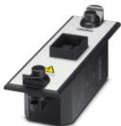
Тестовый адаптер CHECKMASTER 2 для серий PT и PLT-SEC, 35 мм

Обратите внимание на то, что приведенные здесь данные взяты из online-каталога. Полная информация и данные содержатся в документации пользователя. Действуют Общие условия использования для информации, загруженной из интернета. ( http://phoenixcontact.ru/download )