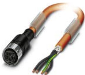
Кабельный штекер, пластиковая заливка, длина: 5 м, цвет наружной оболочки: оранжевый RAL 2003

Обратите внимание на то, что приведенные здесь данные взяты из online-каталога. Полная информация и данные содержатся в документации пользователя. Действуют Общие условия использования для информации, загруженной из интернета. ( http://phoenixcontact.ru/download )