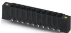
На рисунке показан 10-контактный вариант изделия

Корпусная часть для печатных плат, номинальный ток: 8 А, расчетное напряжение (III/2): 160 В, полюсов: 3, размер шага: 3,5 мм, цвет: черный, поверхность контакта: олово, монтаж: THR пайка, Информация для пользователя и рекомендации по проектированию процесса технологии сквозного печатного монтажа находится в разделе загрузок