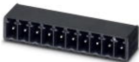
На рисунке показан 10-контактный вариант изделия

Корпусная часть для печатных плат, номинальный ток: 8 А, расчетное напряжение (III/2): 160 В, полюсов: 8, размер шага: 3,81 мм, цвет: черный, поверхность контакта: олово, монтаж: THR пайка