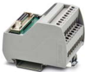
Модуль VARIOFACE с резьбовым креплением и коннектором Amplimate 0.050-D-Subminiature

Обратите внимание на то, что приведенные здесь данные взяты из online-каталога. Полная информация и данные содержатся в документации пользователя. Действуют Общие условия использования для информации, загруженной из интернета. ( http://phoenixcontact.ru/download )