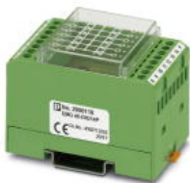
Диодный модуль, с общим катодом, 14 диодов типа 1N 4007

Обратите внимание на то, что приведенные здесь данные взяты из online-каталога. Полная информация и данные содержатся в документации пользователя. Действуют Общие условия использования для информации, загруженной из интернета. ( http://phoenixcontact.ru/download )