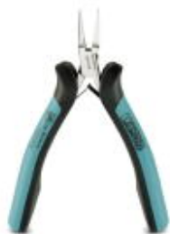
Электронные плоскогубцы, гладкие губки, с открывающей пружиной

Обратите внимание на то, что приведенные здесь данные взяты из online-каталога. Полная информация и данные содержатся в документации пользователя. Действуют Общие условия использования для информации, загруженной из интернета. ( http://phoenixcontact.ru/download )