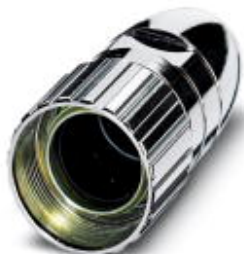
Сальниковый корпус для кабельных соединителей, прямой, Винтовой зажим, M23, экранирован.: нет

Обратите внимание на то, что приведенные здесь данные взяты из online-каталога. Полная информация и данные содержатся в документации пользователя. Действуют Общие условия использования для информации, загруженной из интернета. ( http://phoenixcontact.ru/download )