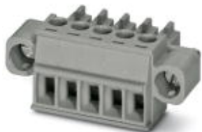
На рисунке показан 5-контактный вариант изделия серого цвета

Обратите внимание на то, что приведенные здесь данные взяты из online-каталога. Полная информация и данные содержатся в документации пользователя. Действуют Общие условия использования для информации, загруженной из интернета. ( http://phoenixcontact.ru/download )