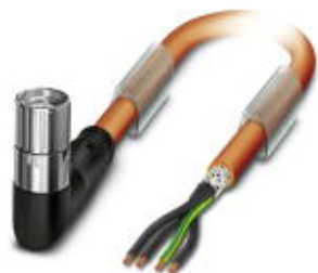
Кабельный штекер, пластиковая заливка, длина: 5 м, цвет наружной оболочки: оранжевый RAL 2003

Обратите внимание на то, что приведенные здесь данные взяты из online-каталога. Полная информация и данные содержатся в документации пользователя. Действуют Общие условия использования для информации, загруженной из интернета. ( http://phoenixcontact.ru/download )