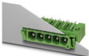
На рисунке показан 5-контактный вариант изделия

Компоненты для проходного монтажа, номинальный ток: 76 А, расчетное напряжение (III/2): 1000 В, полюсов: 7, размер шага: 10,16 мм, цвет: зеленый, поверхность контакта: Серебро, монтаж: Пайка волной припоя