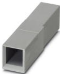
Корпус соединителя, полюсов: 1, цвет: серый

Обратите внимание на то, что приведенные здесь данные взяты из online-каталога. Полная информация и данные содержатся в документации пользователя. Действуют Общие условия использования для информации, загруженной из интернета. ( http://phoenixcontact.ru/download )