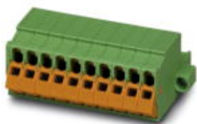
На рисунке показан 10-контактный вариант изделия

Разъемы для печатной платы, номинальный ток: 12 А, расчетное напряжение (III/2): 630 В, полюсов: 5, размер шага: 5 мм, тип подключения: Ножевые контакты, цвет: зеленый, поверхность контакта: олово