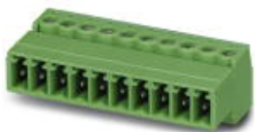
На рисунке показан 10-контактный вариант изделия

Разъемы для печатной платы, номинальный ток: 8 А, расчетное напряжение (III/2): 160 В, полюсов: 6, размер шага: 3,81 мм, тип подключения: Винтовой зажим с натяжной гильзой, цвет: зеленый, поверхность контакта: олово