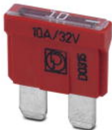
Плоский предохранитель, Form C, цветовая маркировка: красный, номинальный ток: 10A

Обратите внимание на то, что приведенные здесь данные взяты из online-каталога. Полная информация и данные содержатся в документации пользователя. Действуют Общие условия использования для информации, загруженной из интернета. ( http://phoenixcontact.ru/download )