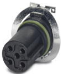
Комплект образцов, 5-полюсн., Гнездо, прямое, M12, В-кодирование, Монтаж на печатную плату, SMD

Обратите внимание на то, что приведенные здесь данные взяты из online-каталога. Полная информация и данные содержатся в документации пользователя. Действуют Общие условия использования для информации, загруженной из интернета. ( http://phoenixcontact.ru/download )