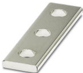
Соединительный элемент, длина: 96 мм, ширина: 25 мм, высота: 4 мм, полюсов: 3, цвет: серебристый

Обратите внимание на то, что приведенные здесь данные взяты из online-каталога. Полная информация и данные содержатся в документации пользователя. Действуют Общие условия использования для информации, загруженной из интернета. ( http://phoenixcontact.ru/download )