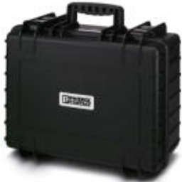
Кейс для транспортировки 4 тестовых адаптеров TRAVTECH CM 2-PA...

Обратите внимание на то, что приведенные здесь данные взяты из online-каталога. Полная информация и данные содержатся в документации пользователя. Действуют Общие условия использования для информации, загруженной из интернета. ( http://phoenixcontact.ru/download )