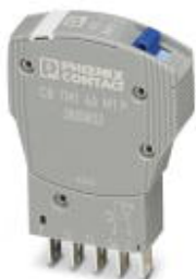
Термомагнитный защитный выключатель, 1-полюсный, характеристика срабатывания М1 (полуинертного типа), 1 переключающий контакт, штекер для базового элемента.

Обратите внимание на то, что приведенные здесь данные взяты из online-каталога. Полная информация и данные содержатся в документации пользователя. Действуют Общие условия использования для информации, загруженной из интернета. ( http://phoenixcontact.ru/download )