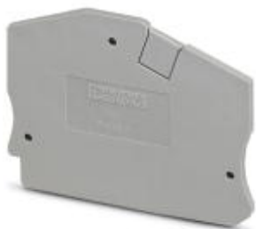
Концевая крышка, длина: 58 мм, ширина: 2,2 мм, высота: 50 мм, цвет: серый

Обратите внимание на то, что приведенные здесь данные взяты из online-каталога. Полная информация и данные содержатся в документации пользователя. Действуют Общие условия использования для информации, загруженной из интернета. ( http://phoenixcontact.ru/download )