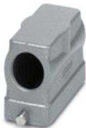
Сальниковый корпус HEAVYCON B16, для крепления одной защелкой, высота 76 мм, с резьбой 1x M40, боковое подсоединение кабеля

Обратите внимание на то, что приведенные здесь данные взяты из online-каталога. Полная информация и данные содержатся в документации пользователя. Действуют Общие условия использования для информации, загруженной из интернета. ( http://phoenixcontact.ru/download )