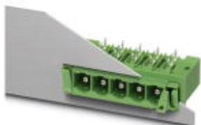
На рисунке показан 5-контактный вариант изделия

Компоненты для проходного монтажа, номинальный ток: 76 А, расчетное напряжение (III/2): 1000 В, полюсов: 9, размер шага: 10,16 мм, цвет: зеленый, поверхность контакта: Серебро, монтаж: Пайка волной припоя