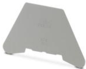
Разделительная пластина, цвет: серый

Обратите внимание на то, что приведенные здесь данные взяты из online-каталога. Полная информация и данные содержатся в документации пользователя. Действуют Общие условия использования для информации, загруженной из интернета. ( http://phoenixcontact.ru/download )