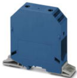
для прямого монтажа

Обратите внимание на то, что приведенные здесь данные взяты из online-каталога. Полная информация и данные содержатся в документации пользователя. Действуют Общие условия использования для информации, загруженной из интернета. ( http://phoenixcontact.ru/download )