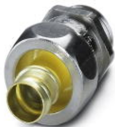
Резьбовое соединение кабеля из латуни с резьбой Pg, класс защиты IP65

Обратите внимание на то, что приведенные здесь данные взяты из online-каталога. Полная информация и данные содержатся в документации пользователя. Действуют Общие условия использования для информации, загруженной из интернета. ( http://phoenixcontact.ru/download )