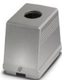
Сальниковый корпус HEAVYCON B48, для продольной защелки, высота 96 мм, с резьбой 1xM50, прямой вывод кабеля

Обратите внимание на то, что приведенные здесь данные взяты из online-каталога. Полная информация и данные содержатся в документации пользователя. Действуют Общие условия использования для информации, загруженной из интернета. ( http://phoenixcontact.ru/download )