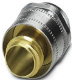
Резьбовое соединение кабеля из латуни с резьбой Pg, поворотное, класс защиты IP40

Обратите внимание на то, что приведенные здесь данные взяты из online-каталога. Полная информация и данные содержатся в документации пользователя. Действуют Общие условия использования для информации, загруженной из интернета. ( http://phoenixcontact.ru/download )