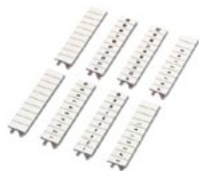
Маркировочная планка Zack, 10 элементов, с одинаковыми числами вдоль полосы: 32, белый, ширина: 5 мм

Обратите внимания на то, что приведенные здесь данные взяты из online-каталога. Полная информация и данные содержатся в документации пользователя. Действуют Общие условия использования для информации, загруженной из интернета. ( http://phoenixcontact.ru/download )