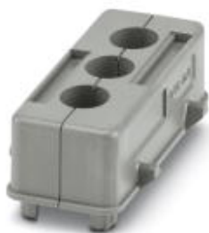
Составной кабельный сальник для монтажного корпуса HC-B16-...; для 3 проводов

Обратите внимание на то, что приведенные здесь данные взяты из online-каталога. Полная информация и данные содержатся в документации пользователя. Действуют Общие условия использования для информации, загруженной из интернета. ( http://phoenixcontact.ru/download )